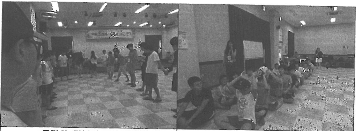
토끼와 거북이 올림픽1